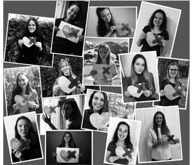
Abb. 1: Unterstützung der Petition Pflaster für die Seele durch BÖP-S & Mind the Mind Austria

Es hat zwar über ein Jahr gedauert, unseren Namen und unser Logo zu ändern, gemäß dem Motto „gut Ding braucht Weile“ sind wir nun aber umso zufriedener damit. Im Zuge dessen haben wir uns vom Orange, das wir sechs Jahre lang verwendet haben, verabschiedet und sind zum bis dahin verwendeten frischen Grün zurückgekehrt. Das Logo und der Name verdeutlichen nun die Zugehörigkeit zum BÖP und machen sie für jeden sichtbar.